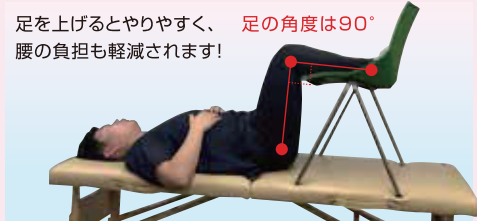
足を上げるとやりやすく、足の角度は90° 腰の負担も軽減されます!