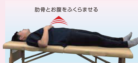
肩があがらないように注意